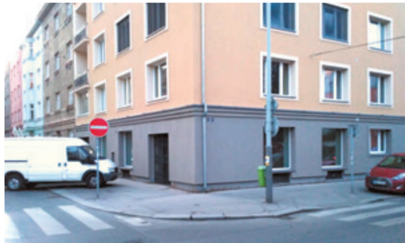
Druhý nápad s umístěním do ulice Pod Primaskou se rovněž nerealizoval.

Jsme rovněž přesvědčeni, že dlouhodobě chátrající objekt, stejně jako již do příprav záměru investované poměrně vysoké finance, práce, čas i energie, by v případě zřízení nízkoprahu konečně našly velmi smysluplné využití.