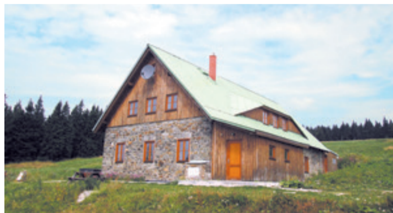
Součást Horského hotelu – 12lůžková chata Sport.

je totiž třeba připočítat ještě 30 korun za každý den a žáka, pro které se vžil název „Zemánkovně“. Tuto sumu byla nucena vybrat každá škola a zasílat ji panu Zemánkovi. Formálním zdůvodněním této platby byly následující služby: doprava zavazadel od lanovky, autobusu, hotelu a zpět, zajištění dopravy poštovních zásilek, doprava do zdravotnického zařízení, zajištění projekční techniky, zajištění vybavení z majetku Prahy