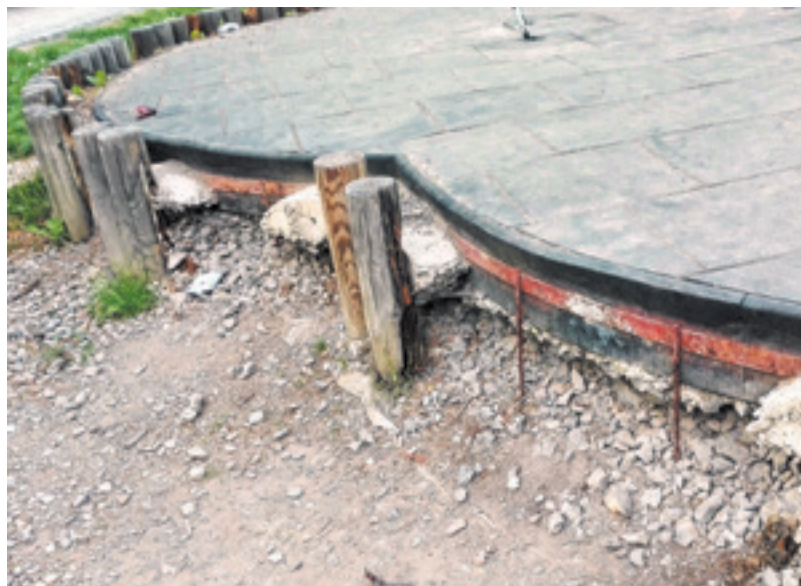
Sportovní areál Gutovka je v péči společnosti Praha 10 - Majetková, a.s.