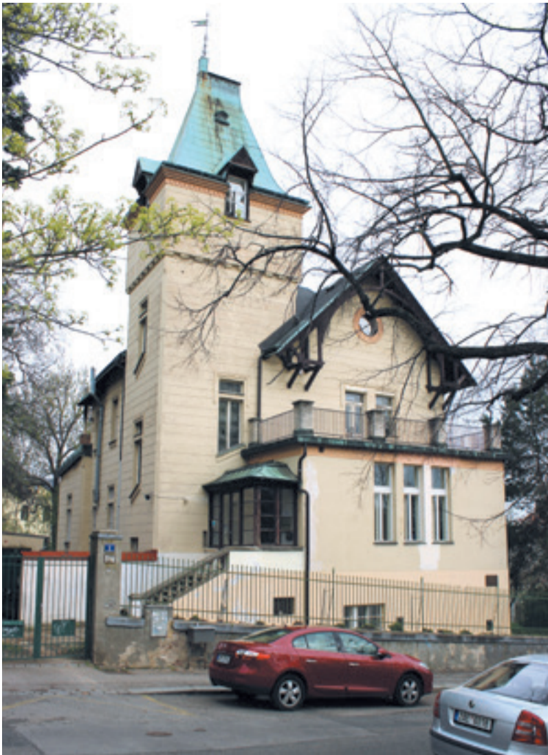
Vila Emila Kolbena.

s celou rodinou do transportu a 3. července 1943 umírá v terezínském ghettu.