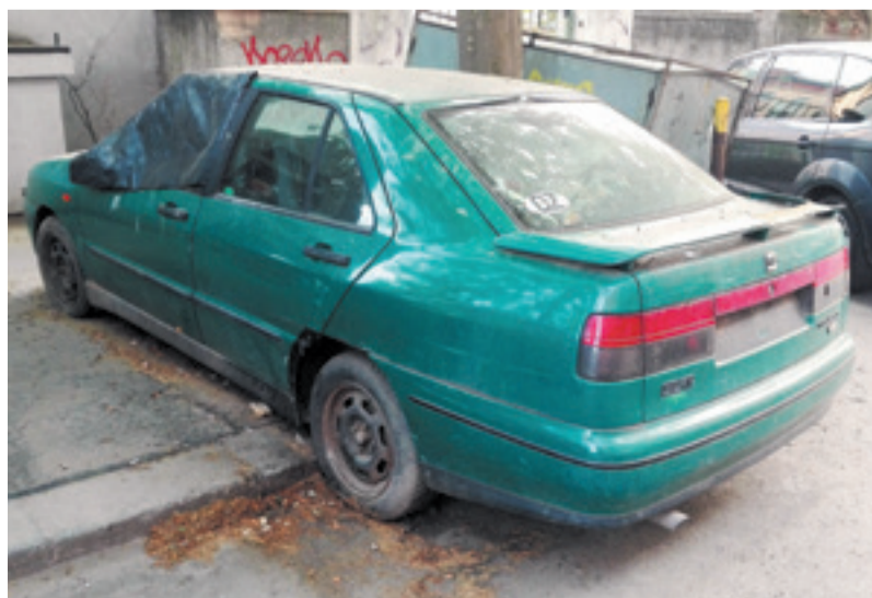
Situace z městských ulic.

Nedílnou součástí koncepce je okamžitě nalezení vhodných lokalit a vybudování záchytných parkovišť u uzlů veřejné dopravy a rozšíření kapacity stávajících parkovišť . Jako příklad navrhujeme vybudování architektonicky citlivě řešeného patrového parkovacího domu v sousedství fotbalového stadionu Bohemians . Tento pozemek je ve správě naší městské části a tímto způsobem by v této exponované oblasti vzniklo až tisíc nových parkovacích míst .