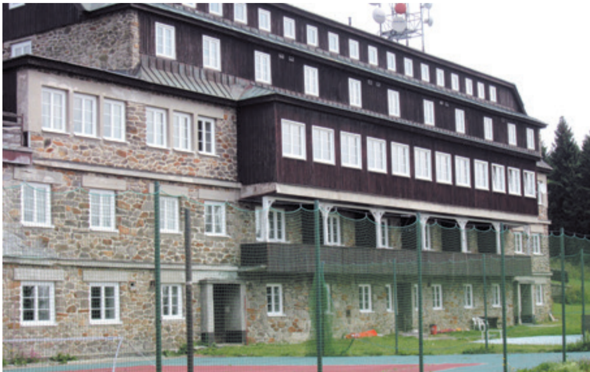
Horský hotel v Jánských Lázních – skanzen komunismu z poloviny osmdesátých let.

Za jeden den pobytu každého dítěte si jeho provozovatel, společnost Gastro servis Zemánek, s.r.o., účtovala 350 Kč bez DPH. Částku 350 Kč za den a žáka opakovaně potvrdili zástupci současné koalice na inscenovaných setkáních s rodiči k Horskému hotelu loni na jaře. Nejenže tato částka převyšuje tržní cenu za obdobnou službu, ale navíc není ani pravdivá. K uvedeným 350 Kč