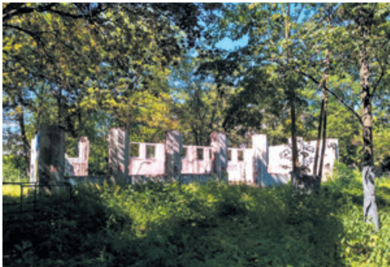
Původně zamýšlené umístění centra v blízkosti Botiče.