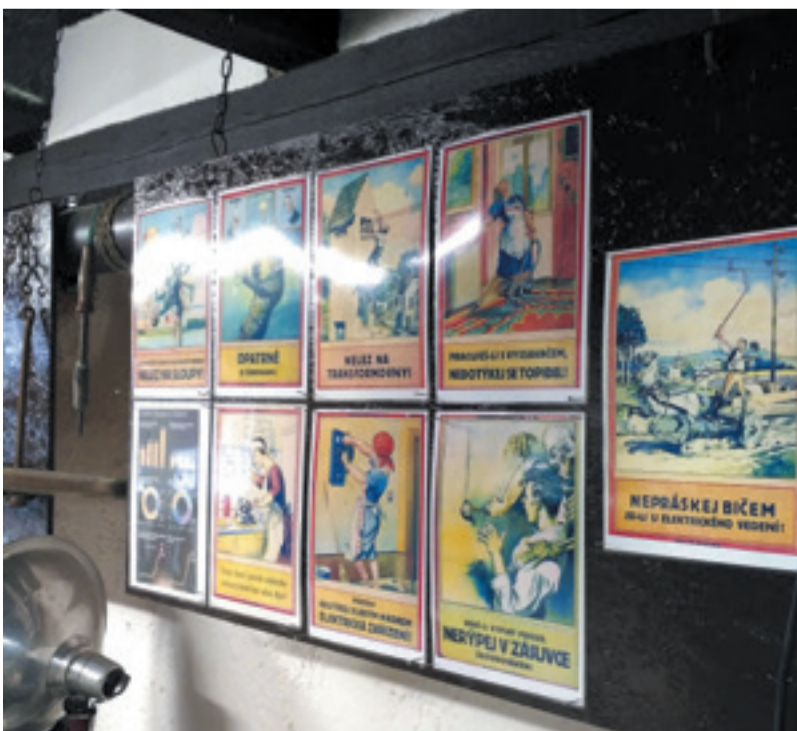
Expozice v muzeu Čechův mlýn.