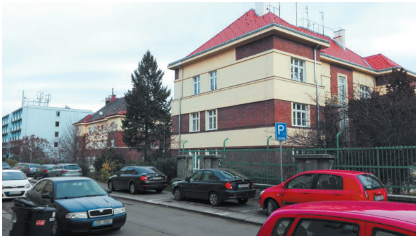
Developerům má ustoupit i dům, ve kterém žil Zdeněk Svěrák v době jeho „Obecné školy“.