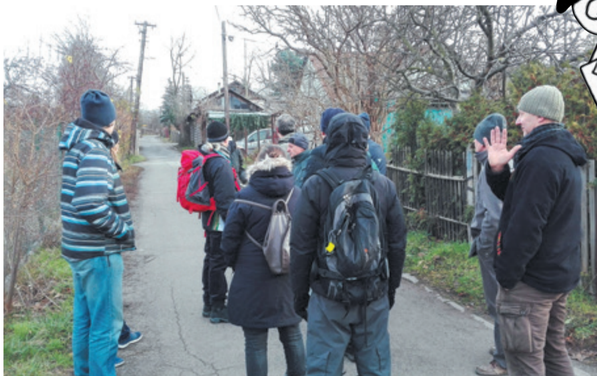
Pirátská procházka po Slatinách.