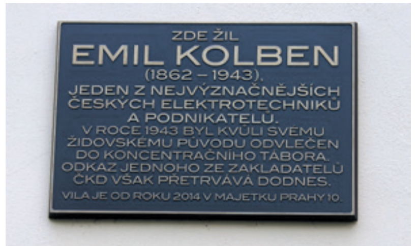
Pamětní deska na vile Emila Kolbena.

Sněžení dále houstlo, museli jsme jet relativně pomalu. Kilometry dojezdu kvůli brodní sněhovou břečkou v kopcovitě krajinně Křivoklátska rychle ubývaly. Pak přišlo řidičovo