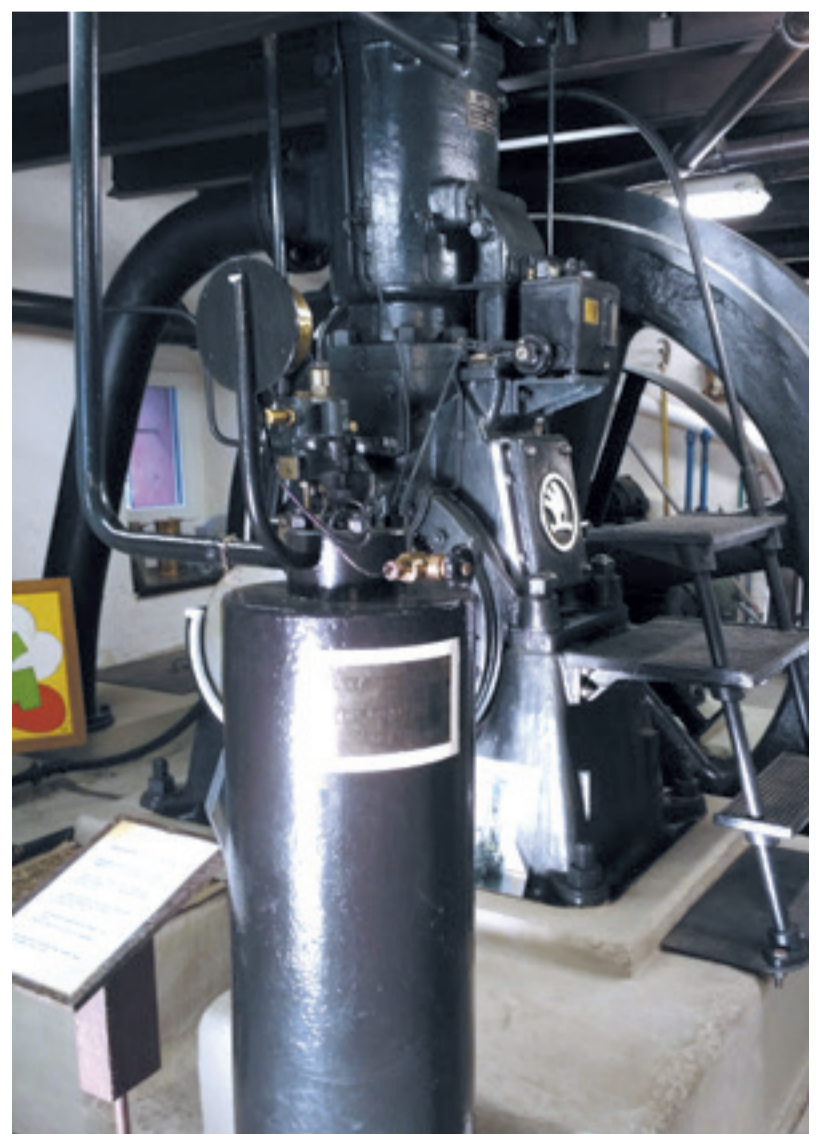
Expozice v muzeu Čechův mlýn.