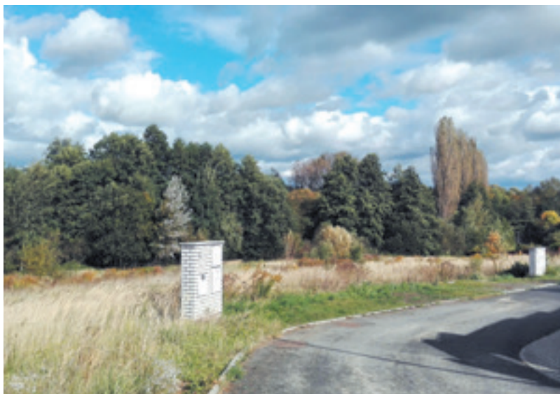
Podle katastru orná půda, ale dobře zasíťovaná.

V nedalekých Pitkovicích koupil v roce 2013 pan Zoufalík přes 4 000 m 2 orné půdy a luk. Tyto pozemky jsou dnes již kupodivu zasíťované a připravené k zástavbě. Předchozí vlastník, kterým byla QI Investiční společnost (IČ: 27911497), tyto pozemky zakoupil v roce 2009 za celkovou částku 4 519 890 Kč. Navzdory svému názvu „investiční společnost“ je po pěti letech držení ve svém majetku prodává s naprosto minimálním zhodnocením za 4 800 000 Kč právě panu Zoufalíkovi. Jeden metr čtvereční tak pan Zoufalík kupuje za 1 166 Kč. Zjevně se u prodávajícího jednalo o náhlý záchvěv dobročinnosti, protože již v roce prodeje (2014), byla cena těchto konkrétních pozemků podle cenové mapy stanovena na 3 700 Kč za m 2 . Tehdejší pan starosta Prahy 10 tak ušetřil pěkných 10 000 000 Kč oproti běžné tržní ceně. Dnes, po dalších pěti letech, je jejich aktuální hodnota 5 070 Kč za m 2 .